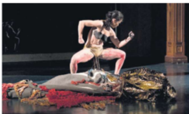
"Me puse al servicio del material que fue apareciendo, quise desaparecer como autora", dice Sario.

Egresada de Psicología de la UBA y de la Escuela Municipal de Danza María Rosaura (desde se formó como maestra y se perfeccionó en danza contemporánea), Sario entrará hoy a las 20.30 horas en el Centro Nacional de la Música (México 564) con una obra íntima y que promete po-